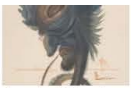
Osessione Dafi, passione, ribellione e lucida follia