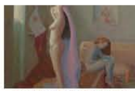
AL VIA LA TRIENNALE DI ROMA