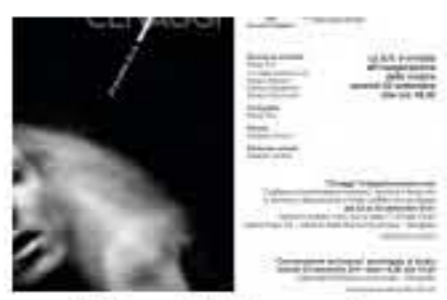
Clivaggi, fotografia, poesia, voce