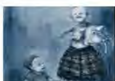
L'Apocalisse ti dona! - Personale di Sergio Padovani a Milano