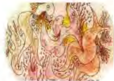
Le Ragioni dell'Incanto - Luciano Pera