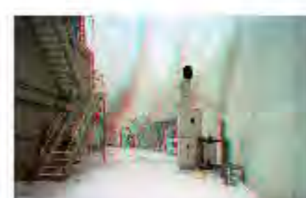
HAPPY TECH. MACCHINE DAL VOLTO UMANO - Triennale Bovisa, Milano